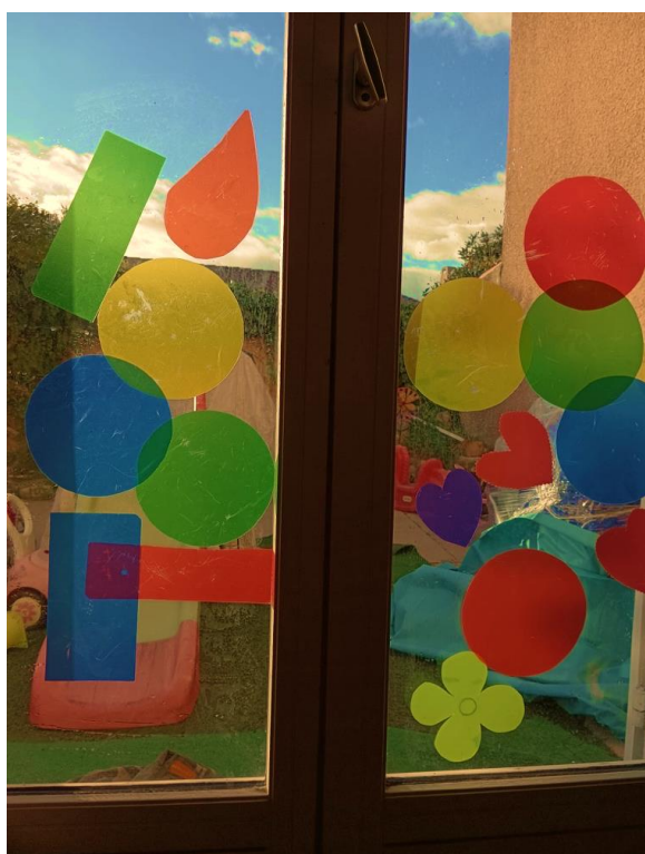
Photo envoyée par Sandrine qui s'est inspirée de l'atelier « À la manière de Tullet » pour se mettre en jeu avec les enfants chez elle. Une manière bien sympathique d'inviter formes et couleurs sur ses fenêtres !

Vous pouvez retrouver Kid&sens sur : https://www.kid-sens.com/